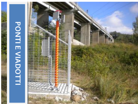
PONTI E VIADOTTI