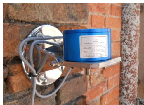
Clinometro da parete