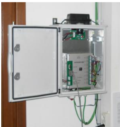
Sistema di acquisizione dati