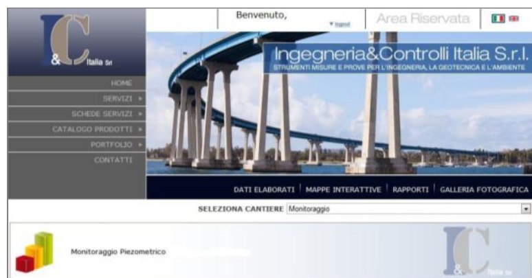
Portale web monitoring on-line